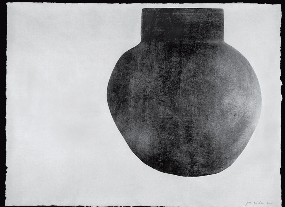
Thing # 04-13, Tirage argentique sur papier coréen. N°4/5. 100 x 75 cm