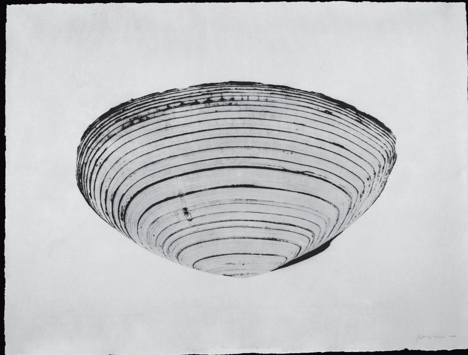
Thing # 04-18, Tirage argentique sur papier coréen. N°1/3. 200 x 140 cm