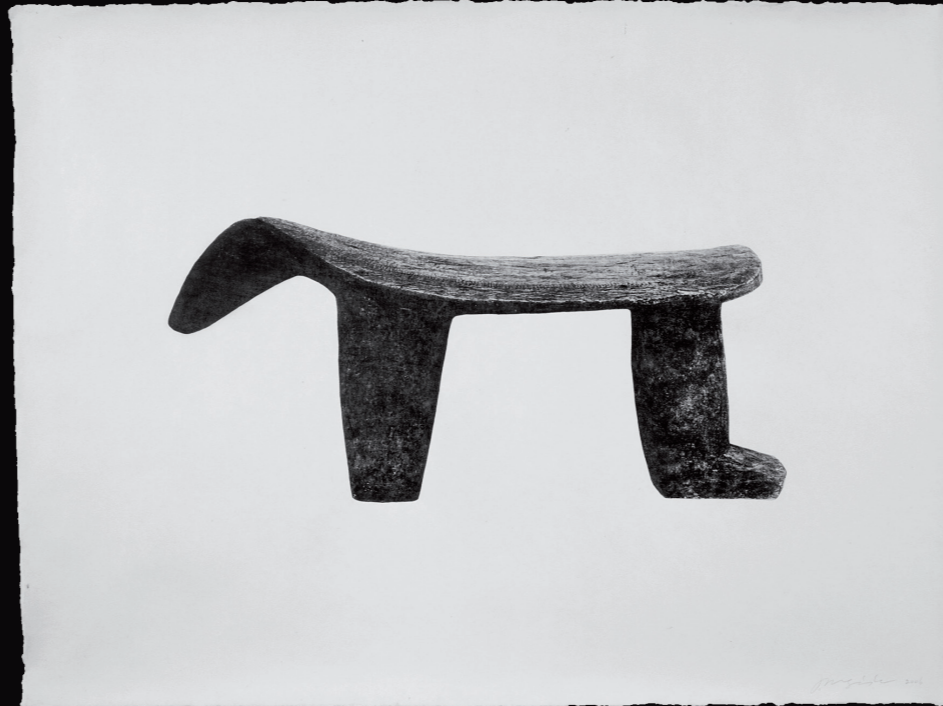
Thing # 06-63, Tirage argentique sur papier coréen. N°2/5. 100 x 75 cm