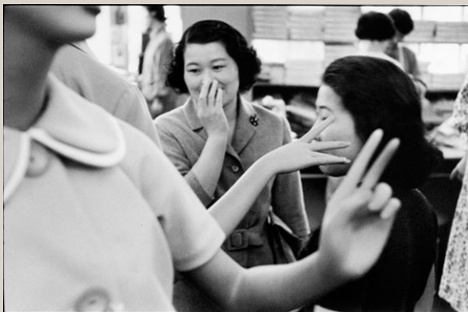
Marc Riboud Japon, 1958. Tirage argentique moderne. 40 x 50 cm