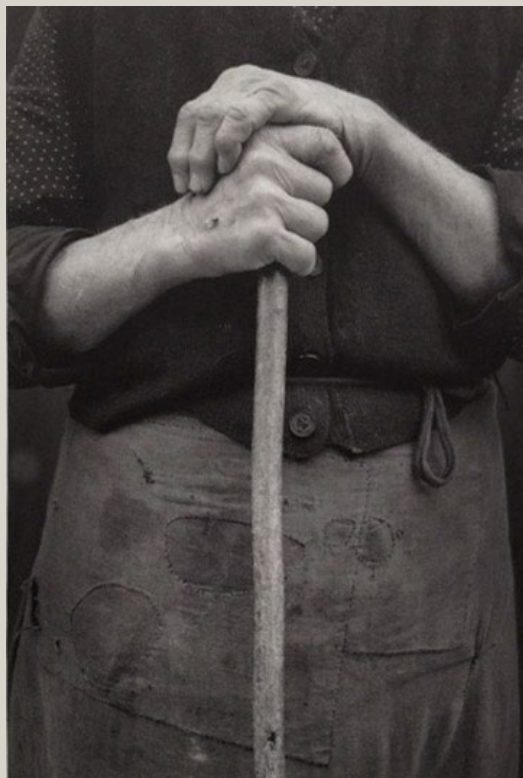
Pentti Sammallahti Zemplén, Hongrie, 1979.. Tirage argentique. 18 x 24 cm

Variations sur le thème de la main par dix-neuf photographes Galerie Camera Obscura / 29 janvier - 14 mars 2015