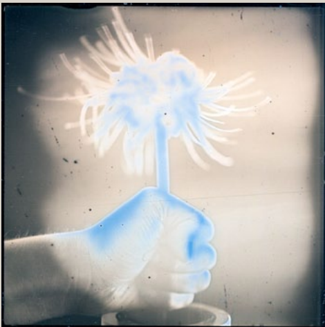
Takashi Arai My right hand on harvesting, 2011 Daguerréotype. 10 x 10 cm