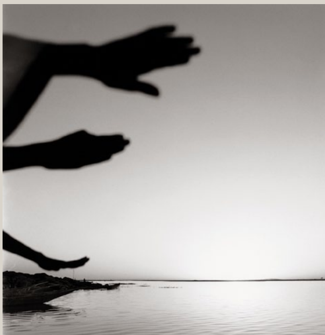
Bernard Descamps Fleuve Niger, Sendégué, Mali, 1998. Tirage argentique. 50 x 60 cm