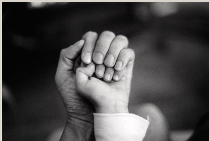
Bernard Plossu La main de Shane États-Unis, 1982 Tirage argentique. 18 x 24 cm

Pour les photographes qui font de leur vie le matériau d'une oeuvre, la main est un sujet qui tombe sous le sens du regard.