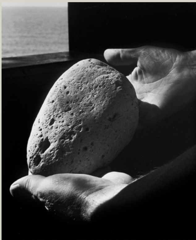
Lucien Hervé Les mains de Le Corbusier, 1952. Tirage argentique moderne. 30 x 40 cm

Variations sur le thème de la main par dix-neuf photographes Galerie Camera Obscura / 29 janvier - 14 mars 2015