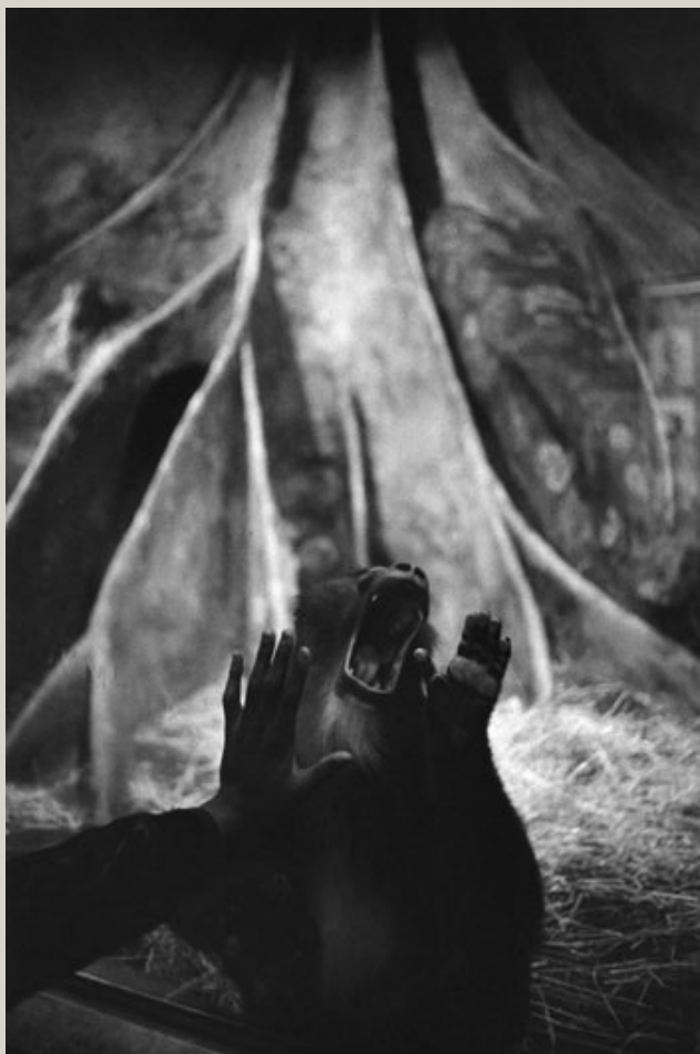
Michel Vanden Eeckhoudt New Yorki, 1982. Tirage argentique. 50 x 60 cm

Variations sur le thème de la main par dix-neuf photographes Galerie Camera Obscura / 29 janvier - 14 mars 2015