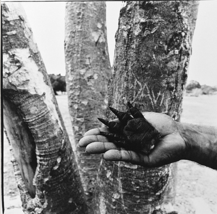
Max Pam Darwin, Australie, 1986. Tirage argentique. 40 x 50 cm

Darwin - 1986 - This kangaroo paw is all that was left over from the Bagot Aboriginal Aboriginal Community football team Barbeque. These social functions are big, generous affairs with people from many communities partaking of 15 different meats Lizard (goanna) B B Op ed Kangaroo Roast of Dugong (manatee) baked Barramundi along with the relative newcomers to traditional hunter gatherer cuisine - Snags and Bones