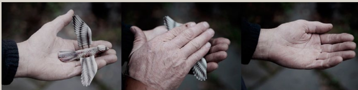
Gregor Beltzig Série "Les boîtes des sentiments", 2012. Tirage jet d'encre sous résine. 5 x 20 cm