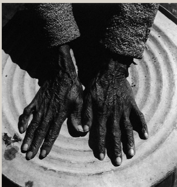
Debbie Fleming Caffery Harry's hands, Louisiana, 1989. Tirage argentique. 50 x 60 cm