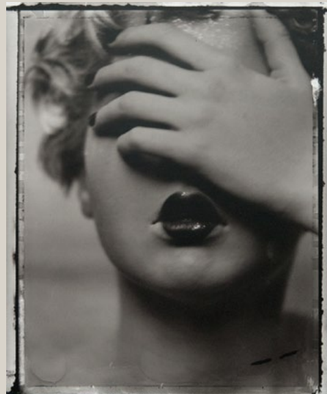
Sarah Moon G.S., 1998 Tirage argentique. 50 x 60 cm

Elle est là comme un signe qui nous inviterait à saisir une présence, à décrypter un sens.