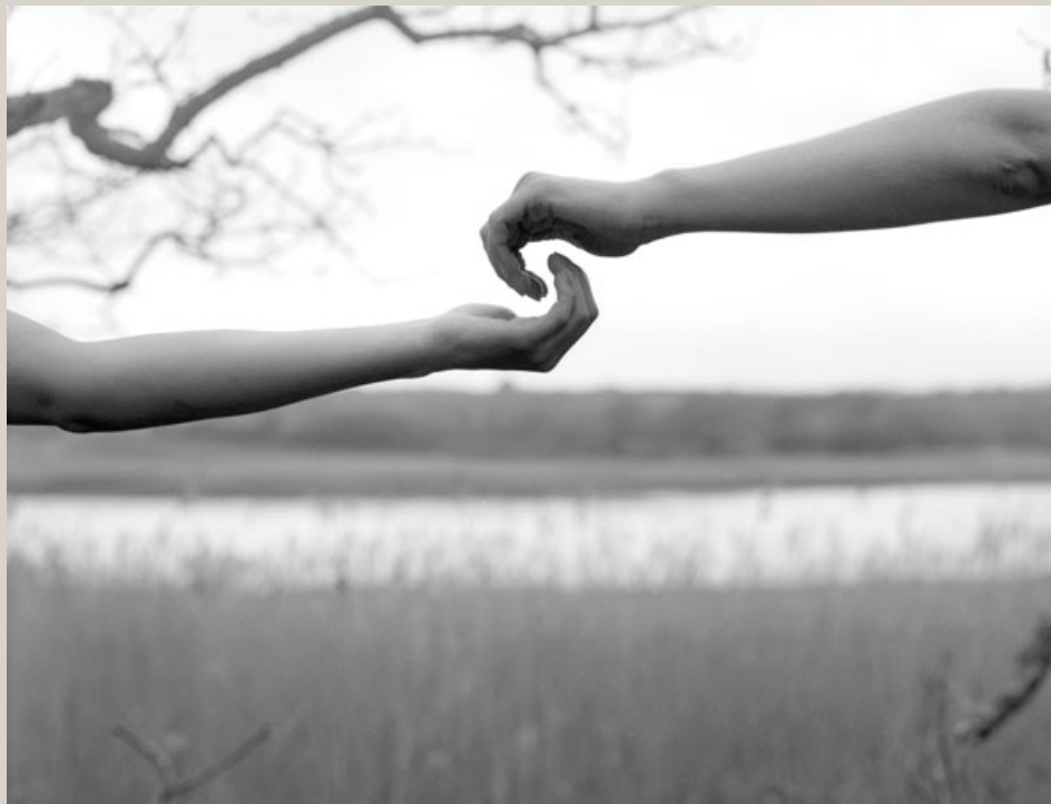
Arno Rafael Minkinen Freshwater Bay, Isle of Wight, England, 2002. Tirage argentique. 50 x 60 cm

Variations sur le thème de la main par dix-neuf photographes Galerie Camera Obscura / 29 janvier - 14 mars 2015