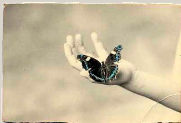
Masao Yamamoto # 1213. Tirage argentique. 8 x 12 cm