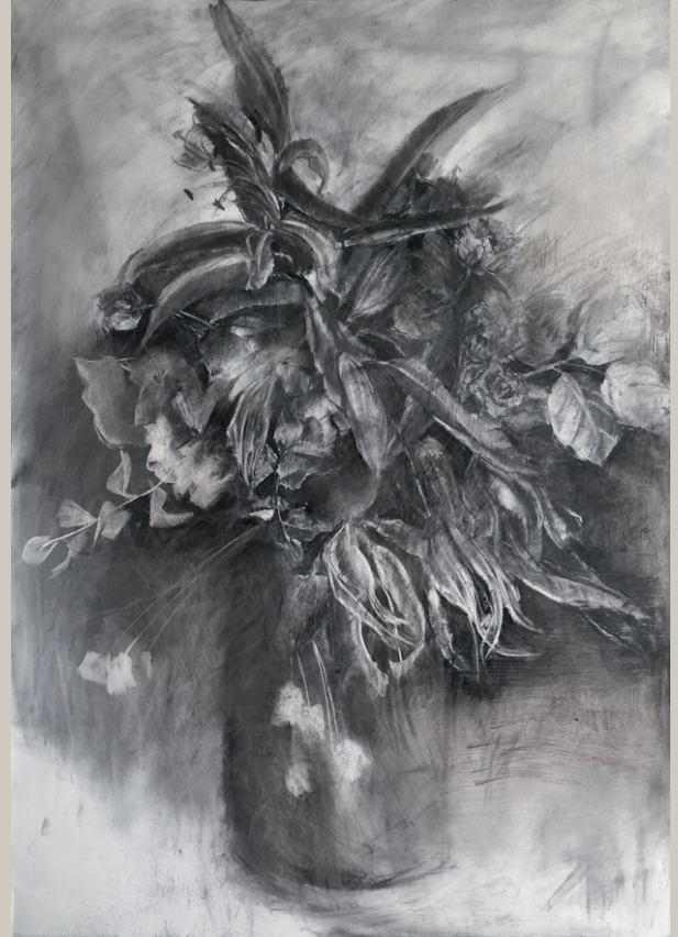
Bouquet, 82 x 57 cm