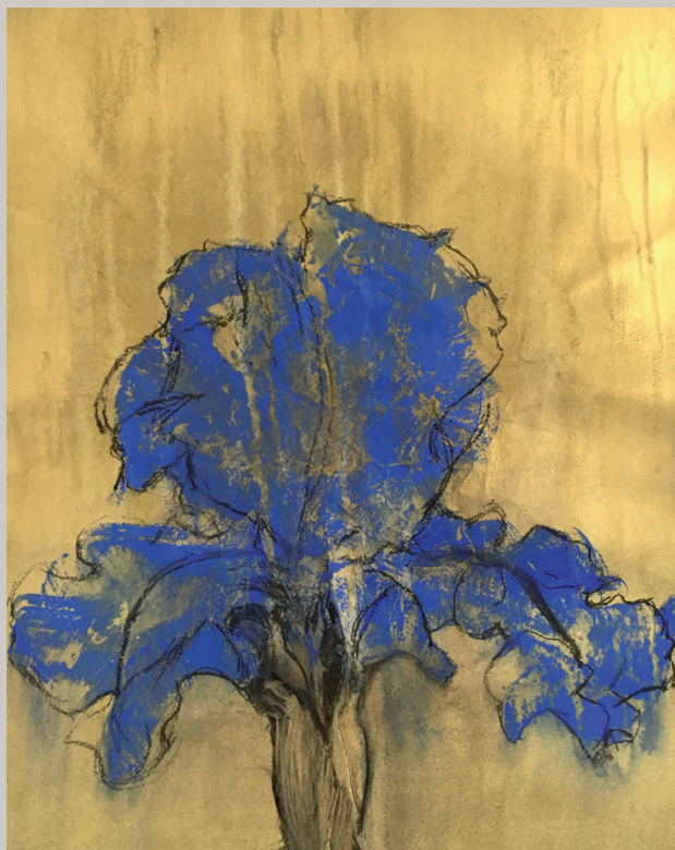
Iris, 2017 Acrylique sur papier / technique mixte, 34 x 44,5 cm

Née en Afrique du Sud où elle a grandi, Ilona Suschitzky est diplômée des Beaux Arts de Johannesburg. Depuis 1974, elle vit en Angleterre où elle est connue pour ses travaux de graphisme, ses œuvres peintes et ses dessins. Elle a réalisé des livres d'artistes, notamment en collaboration avec Sarah Moon, a illustré de nombreux livres pour enfants (dont les contes du Grand Buffle chez Gallimard en 2008) et effectué des travaux de commande, comme des pochettes de disques ainsi que des portraits. De 1976 à 1983, Ilona a travaillé comme assistante de recherche auprès de Sir Lawrence Gowing, professeur à Slade, University College London, ce qui lui a donné l'occasion unique de collaborer à de nombreuses monographies, notamment sur Matisse et Lucien Freud, mais aussi à des collections sur l'histoire de l'Art et de nombreux catalogues d'exposition remarquables. En 1983, elle a reçu le prestigieux prix Richard Ford et obtenu une bourse pour étudier la peinture au Musée du Prado à Madrid. Ses œuvres ont fait l'objet d'expositions dans des galeries d'art de Londres. Personnalité discrète, à contre-courant des modes et des tendances, elle poursuit ses recherches personnelles et continue de travailler notamment sur différents projets d'expositions pour enfants avec l'organisation caritative "Photovoice".