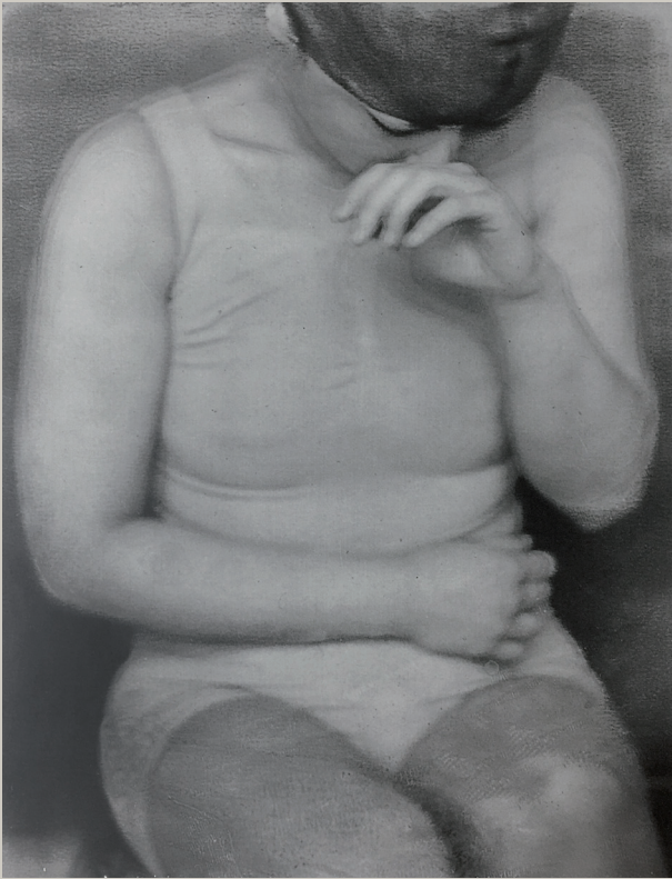
Baigneuse, 54 x 41 cm