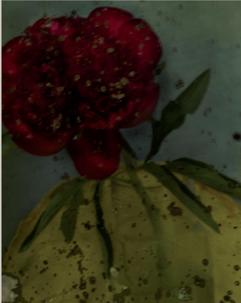
L'avant-dernière pivoine, 2011. Tirage charbon couleur. 57 x 43 cm

Référence dans l'histoire de la photographie de mode, Sarah Moon a créé un style et un univers qui dépassent les seuls territoires de la photographie appliquée. Elle est simplement une artiste dont l'œuvre parle tout autant de la beauté que de la disparition, de la perfection miraculeuse d'un instant, que de la lente corruption des choses. La photographie de Sarah Moon est proche des contes : un émerveillement du monde toujours menacé par la perte. On sent une faille dans ce monde ancien : la disparition, la menace affleurent dans bien des photographies.... Mais aussi, toujours, la beauté, le souvenir de l'enfance, des amis, la volupté de la forme et de la couleur.