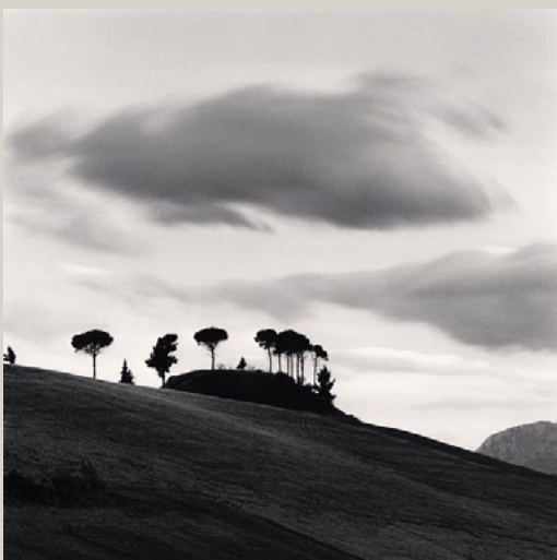
Pine Trees at Dusk, Loreto Aprutino, Abruzzo. 2016