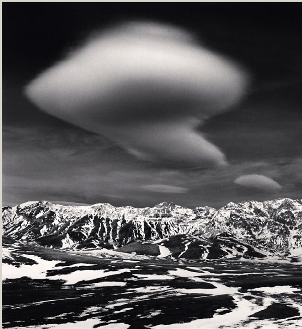
Curious Cloud, Campo Imperatore, Italie, 2016