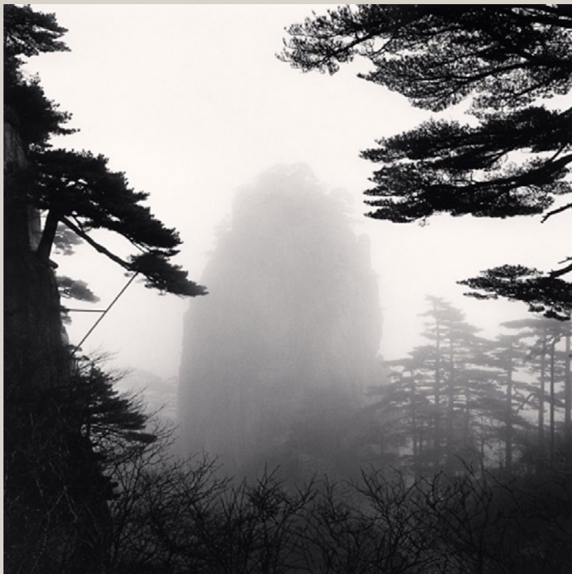
Huangshan Mountains, Study 50, Anhui, China. 2017