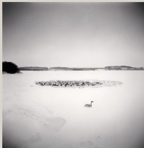
Cygnets, Kussharo Lake, Hokkaido, Japan. 2007