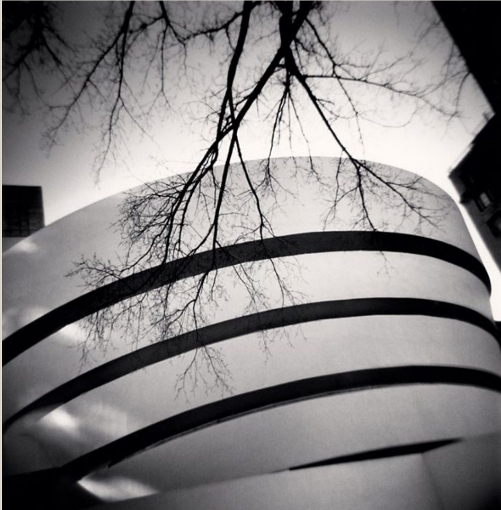
Guggenheim Museum, Study I, New York, USA. 2010