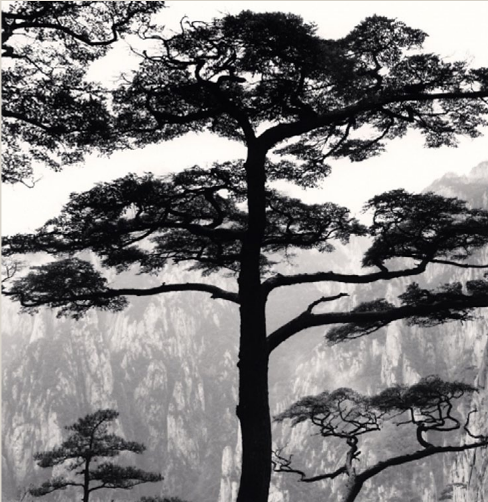
Huangshan Mountains, Study 53, Anhui, China. 2017

« Je me suis rendu à quatre reprises à Huangshan. En décembre 2007, février 2009, mars 2010 et l'année dernière pour une dernière visite. Comme on pouvait s'y attendre, peu de choses avaient apparemment peu changé lorsque je suis monté sur la montagne en mars 2017, mais en réalité tout avait changé. Eugene Atget, le grand photographe français qui a photographié Paris toute sa vie durant, nous a appris que rien n'est jamais pareil. Comme il a raison. J'ai marché sur les mêmes chemins que j'avais emprunté auparavant et j'ai encore fait des découvertes, car Huangshan est vivant, organique, comme nous. Huangshan change, comme nous changeons. Les montagnes vieillissent, comme nous tous. Huangshan est un joyau de la Terre et le restera encore pendant plusieurs milliers d'années. Quel plaisir de photographier cette incroyable partie de l'univers. Je suis impatient de renouveler et d'approfondir ma connaissance de Huangshan dans un avenir très proche. »