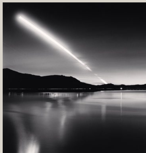
Moon Set, Lake Campotosto, Abruzzo, Italy. 2015