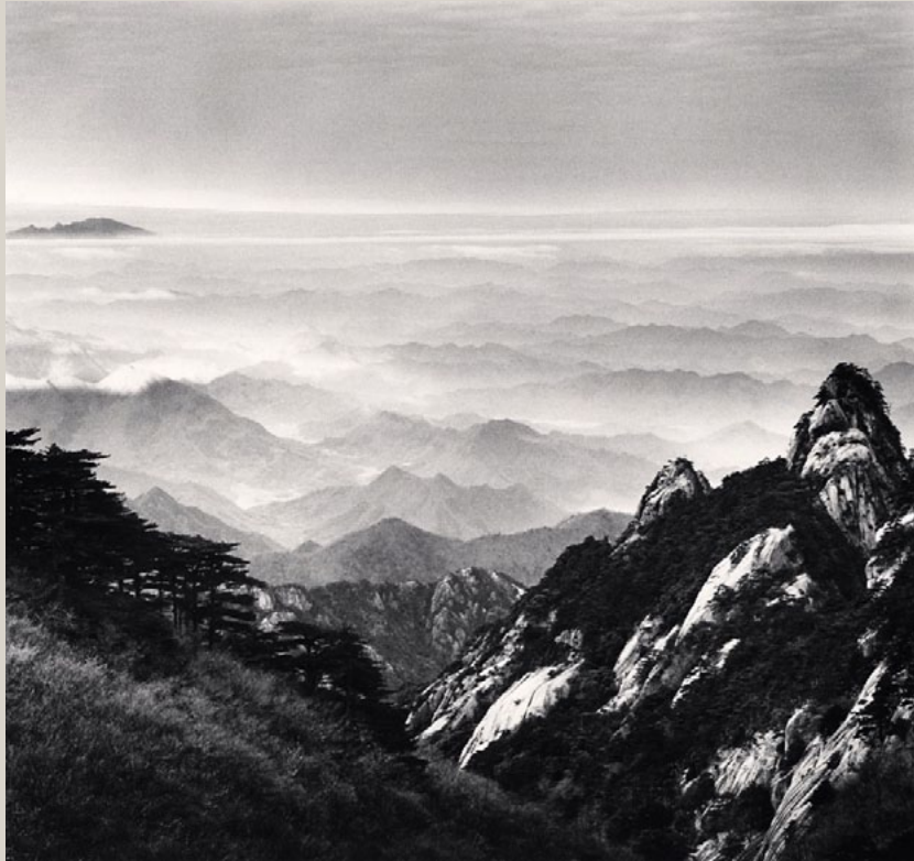
Huangshan Mountains, Study-51, Anhui, China. 2017