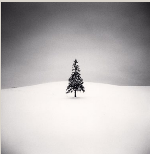
Lone-Tree, Study 2, Bibaushi, Hokkaido. 2004