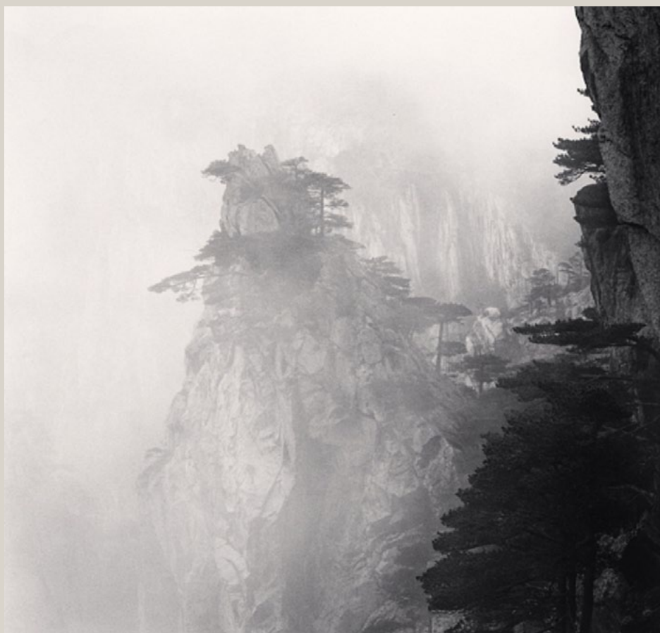
Huangshan, Mountains, Study 56, Chine 2017

Nous présenterons également des nouvelles images des montagnes jaunes, paysages extrêmement picturaux célébrés par la tradition chinoise. Le livre Huangshan , paru en 2010, avait connu un grand succès et s'était trouvé rapidement épuisé. Une réédition chez Nazraeli Press vient de paraître, enrichie de quatorze nouvelles images.