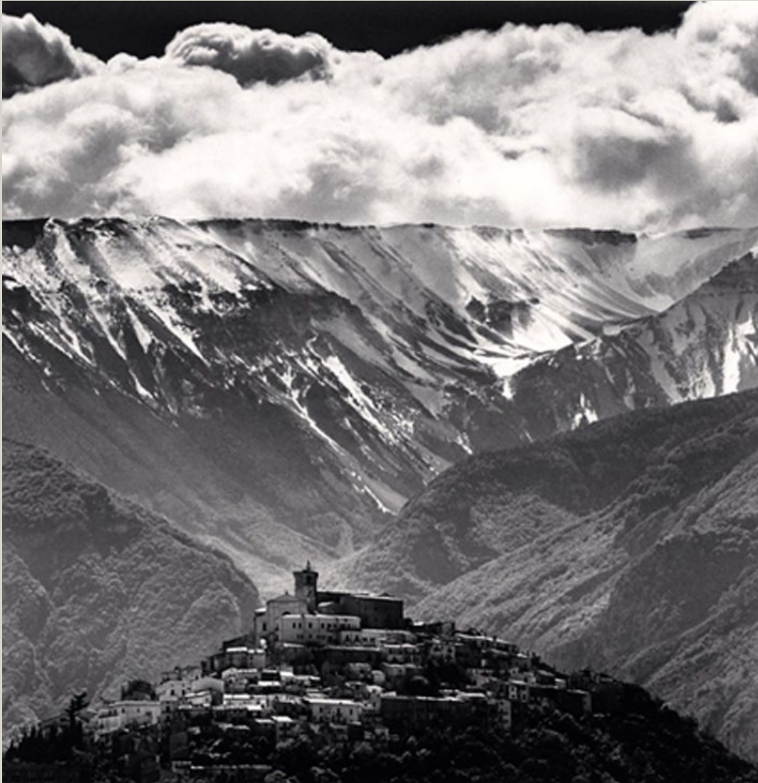
Gathering Clouds, Casoli, Abruzzo, Italy. 2016