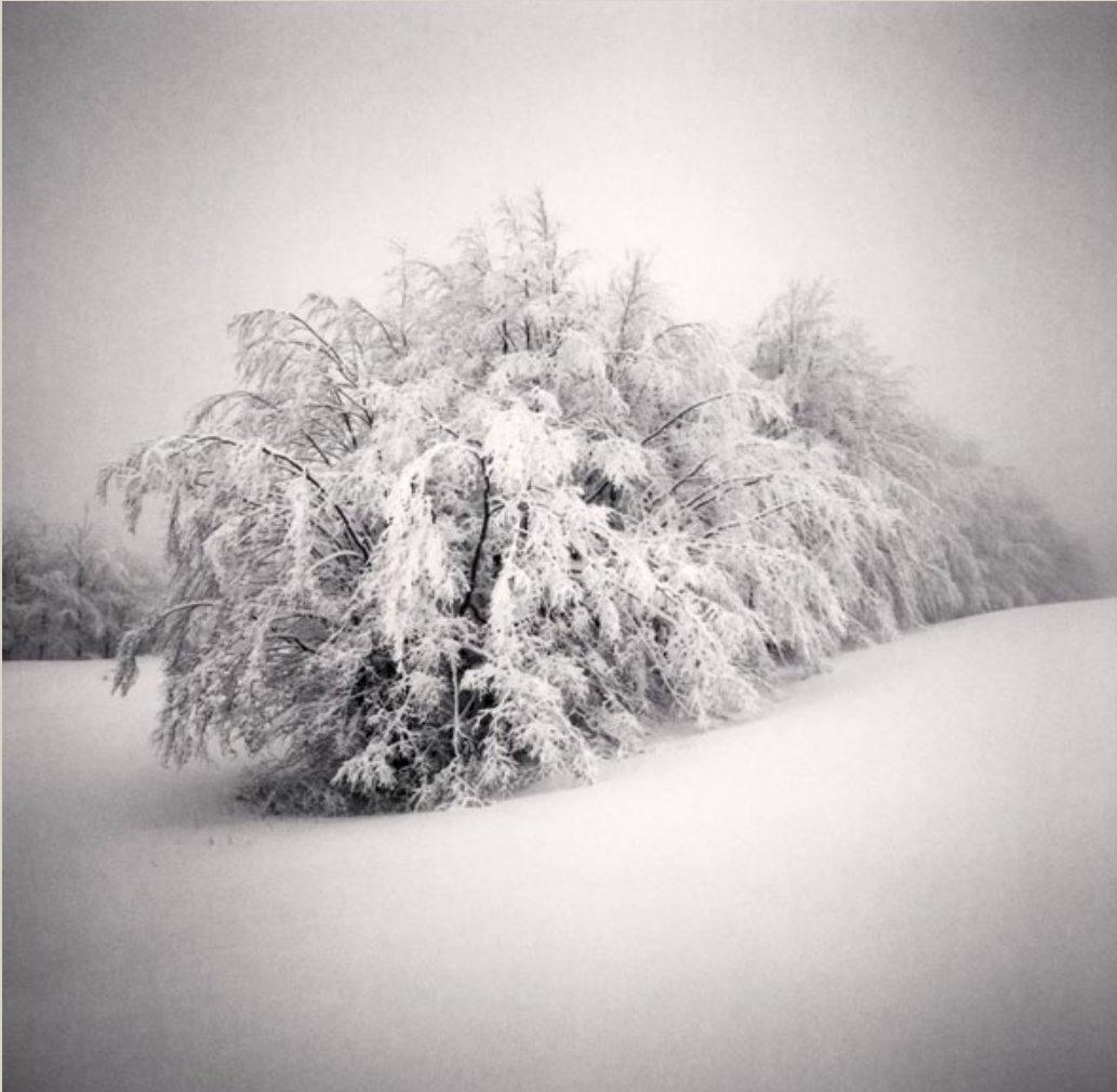
Passo delle Radici, Emilia Romagna, Italy, 2008

Michael Kenna a également publié récemment un livre de photographies réalisées au Holga, petit appareil de fabrication rudimentaire dont la simplicité autorise liberté et improvisation. Vendu à l'origine en Chine, cette petite boîte en plastique noir, prend des photographies au format carré. La forme parfaitement maîtrisée de Kenna, ses cadrages au cordeau, s'accordent parfaitement du manque de précision «impressionniste» caractéristique du Holga et sait aussi s'ouvrir aux joies du hasard et de la légèreté.