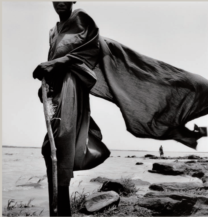
Berger Peul, Mali, 1997