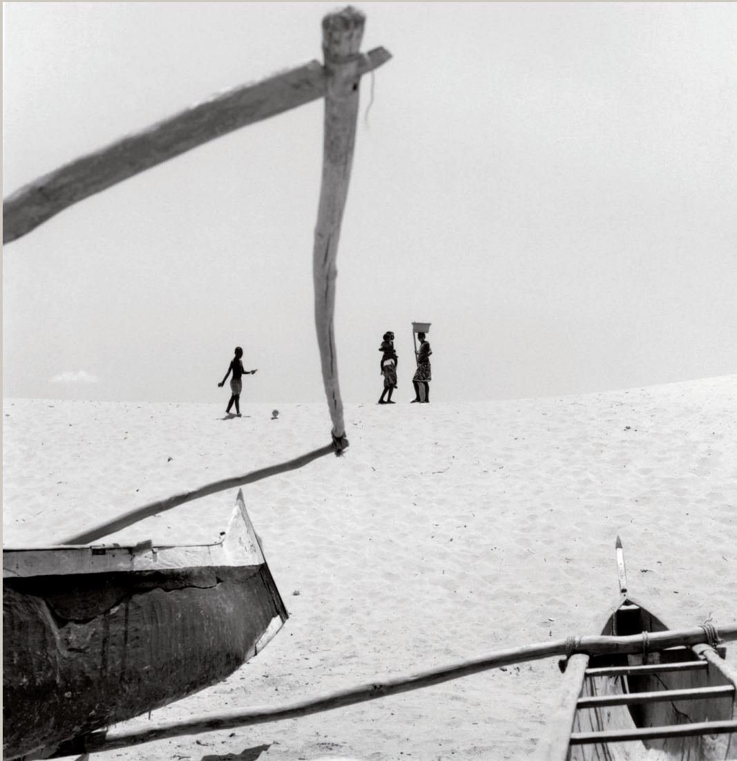
Sarondrano, village de pêcheurs, Madagascar, 2009

L'histoire de Bernard Descamps avec l'Afrique commence en 1982 : le coup au coeur de découverte du Sahara. S'en suit un livre préfacé par Tahar Ben Jelloun en 1987. Puis l'aventure des Rencontres Africaines de la Photographies de Bamako dont il est l'un des initiateurs avec Françoise Huguier, en 1994. Entre temps, Bernard Descamps a abandonné le format 24 x 36 pour voir le monde sur le dépoli d'un 6 x 6, dans ce format carré qui va lui donner dorénavant son équilibre. Il a commencé à photographier le fleuve Niger et les populations Peul qui vivent près de lui. Émerveillement et rencontres marquantes. Le très beau livre issu de cette expérience est publié par Filigranes en 2000. Cet éditeur est fidèle à Descamps et clos aujourd'hui ce cycle africain avec «Quelques Afriques». Dans les propos recueillis par Brigitte Ollier, en postface de l'ouvrage, on trouve cette phrase qui résume bien l'état d'esprit dans lequel Bernard Descamps aborde le voyage, la photographie :