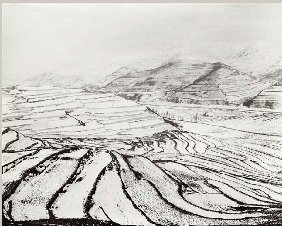
Ma Zi Chuan, Gansu

"Je ne m'intéresse qu'à ce que je reconnait comme beau, bon et humain. L'ultime but de ma vie est de retenir, le temps d'une image, l'équilibre fragile du temps, de l'espace et de la matière avec au centre l'Homme. Le reste n'intéresse pas, chez moi, ma pratique de la photographie. Mon engagement est spirituel, humain et esthétique."