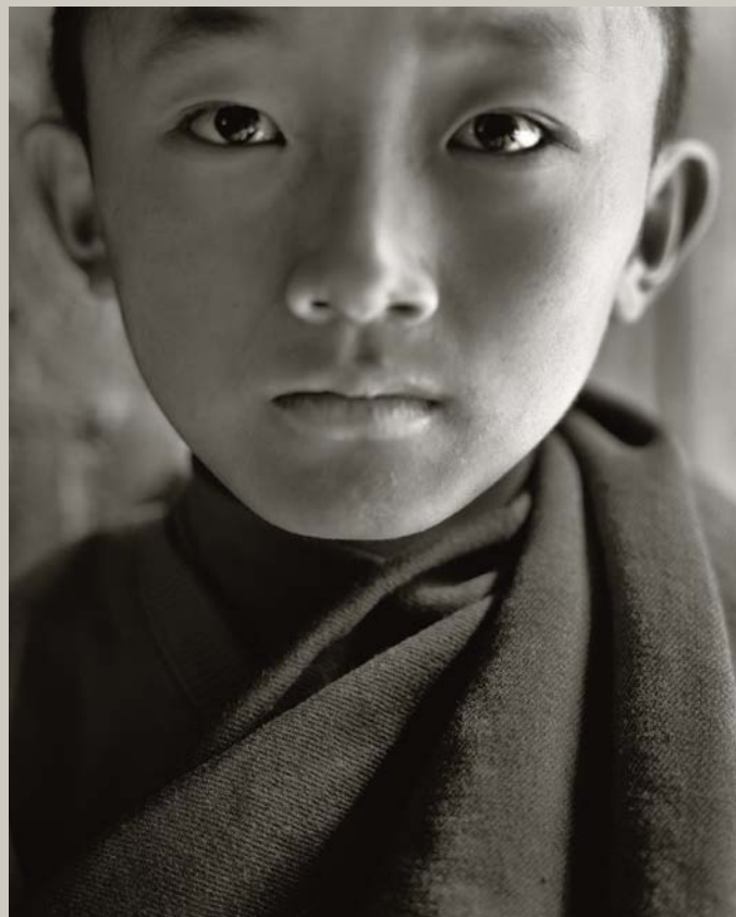
Sen Nong Qi Zong, Sichuan

La forme donnée à l'image, est primordiale dans l'art de Dessert. Il y met une sensualité, un amour de la matière, de la lumière, qui fait absolument partie de sa photographie.