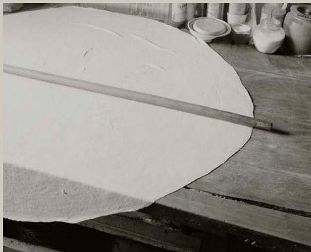
Hai Ling po, Gansu